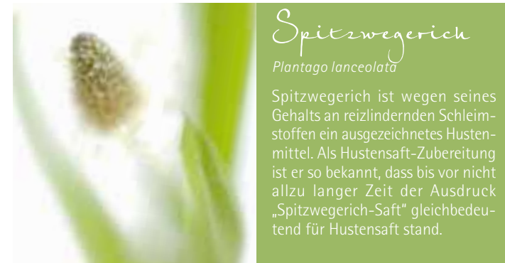
Spitzwegerich Plantago lanceolata

Plantago Bronchialbalsam . Anwendungsgebiete: katarrhalisch-entzündliche Erkrankungen der Luftwege. Warnhinweis: Arzneimittel enthält Wollwachs und Erdnussöl.